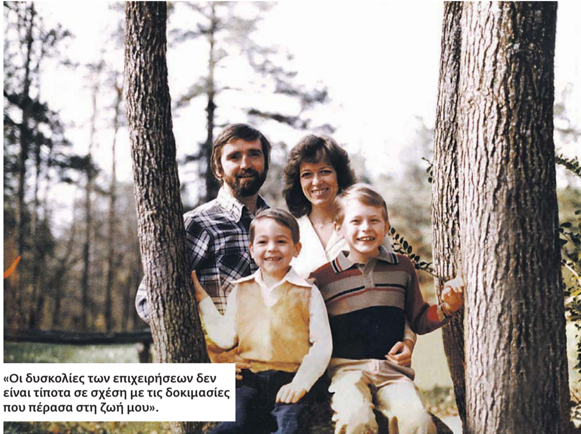
«Οι δυσκολίες των επιχειρήσεων δεν είναι τίποτα σε σχέση με τις δοκιμασίες που πέρασα στη ζωή μου».

Εντέλει, βρήκε δουλειά. Κολλούσε ετικέτες σε κουτιά μογιόγας, στο υπόγειο της εταιρίας χρωμάτων Glidden, στην Ατλάντα. Οργάνωσε από την αρχή το τμήμα ετικετών και βοήθησε την Glidden στη μηχανοργάνωσή της. Δούλεψε από το πρωί μέχρι το βράδυ: